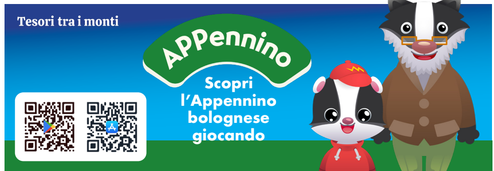
UnAltroStudio.it | Foto di Roberto Neri