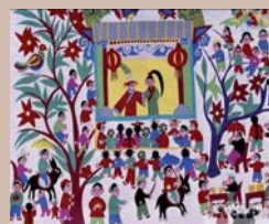
Lavorare con la comunità