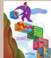
Lavorare in emergenza